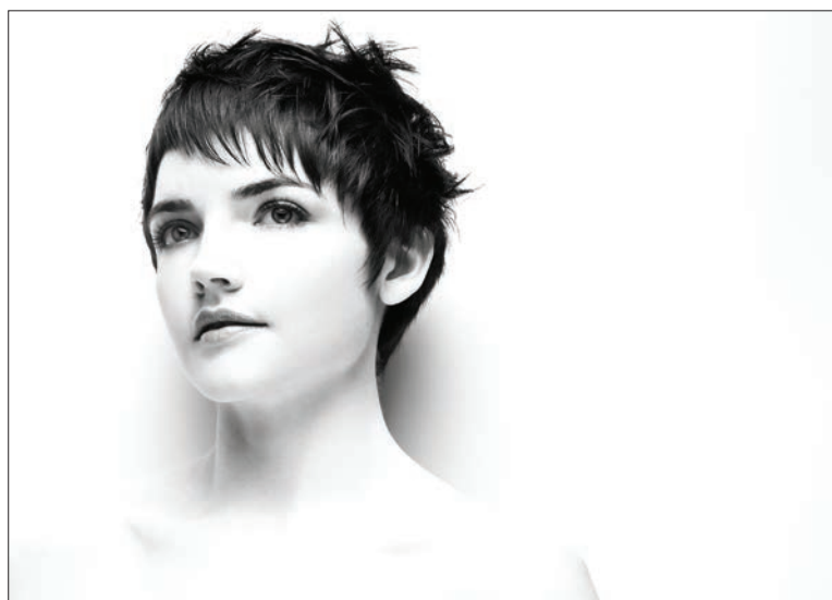
18 (PO LEWEJ).